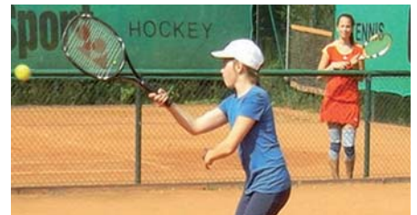
Zuerst kamen alle Teilnehmer ganz schön ins Schwitzen ...