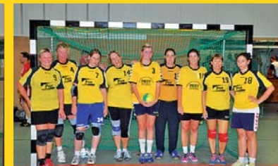
Spielgemeinschaft Frauen Thuro - OA/FTV