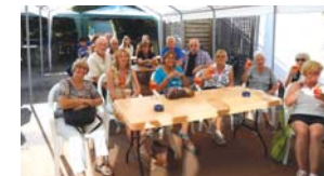
Auch hier erfrischten sich ein Teil der Teilnehmer mit einem Getränk