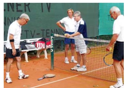
Die Zeremonie vor jedem Spiel wird auch hier vollzogen: Wahl der Seite und oder des Aufschlagrechts