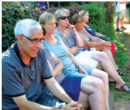
Lebhafte Interesse herrschte bei allen Spielen.