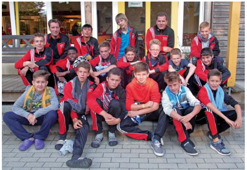
1.C-Junioren „Schönhagen 2013“