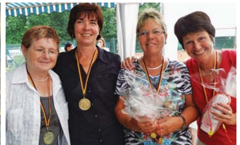
Diese vier Damen haben gut gelacht, sie gewannen in der Doppelkonkurrenz Damen 110+ glänzende Medaillen.