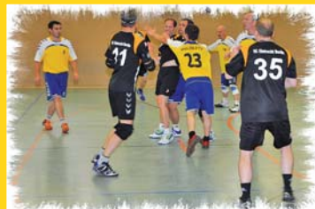
Unsere Männer im Einsatz