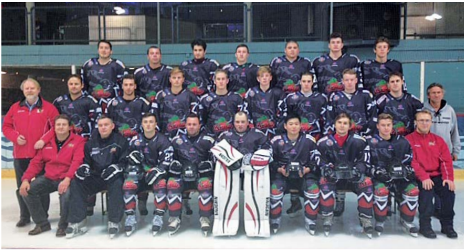
Mannschaftsfoto: Crocodiles Hamburg

Der Herbst legt sich langsam über den Nordosten Hamburgs und im Eisland Farmsen hört man das Donnern der Pucks und das Kratzen der frisch geschliffenen Schlittschuhe auf der noch spiegelglatten Eisfläche. Das kann nur eines bedeuten: die Eishockeysaison startet!