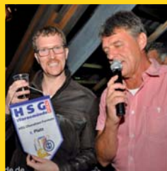
4. Platz für unsere Männer