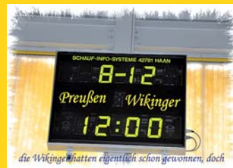
Ergebnis: Preußen - Wikinger die Wikinger hatten eigentlich schon gewonnen, doch