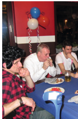
Team Rot >>> Team Blau >>> Team Schwarz