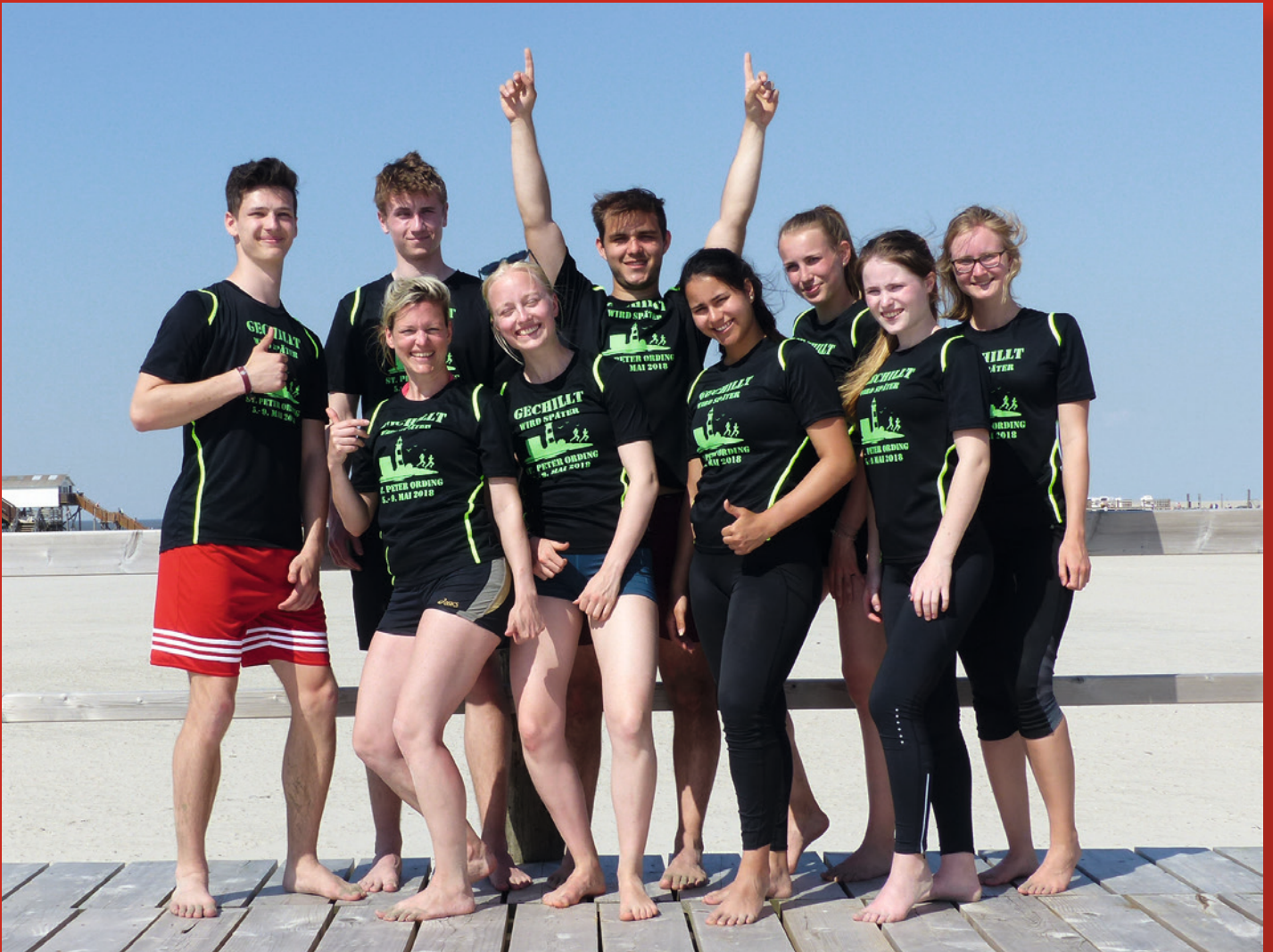
Neun FTVer und LAVer Leichtathleten sportlich im Trainingslager am endlosen Strand von St. Peter Ording.