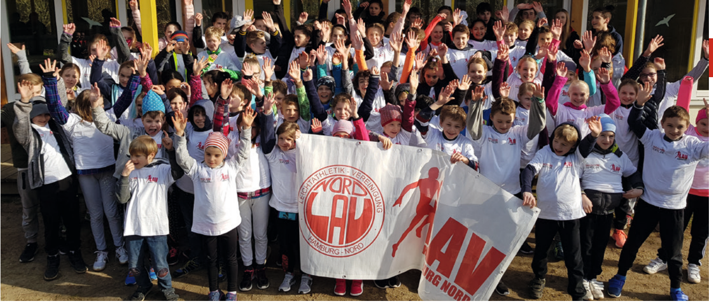
Große und kleine Athletinnen und Athleten sportlich zusammen in Schönhagen, davon 20 vom FTV & 3 begleitende Trainer.