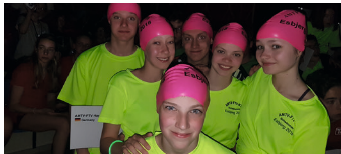
Nicht nur mit unseren neongelben T-Shirts fielen wir beim Einmarsch der Vereine auf...

Auf ein Wiedersehen 2019. Die Unterkünfte sind schon gebucht!!