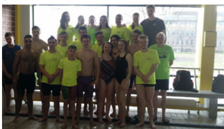
Unsere Schwimmer im Trainingslager in Northeim

Das Wochenende war lang und anstrengend, aber es hat sich gelohnt. Viele Medaillen durften unsere Schwimmer mit