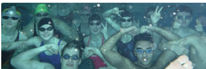
Der Spaß darf im Trainingslager auch nicht zu kurz kommen...