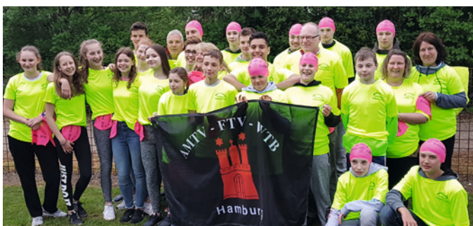
Unser Team in Esbjerg.

Es war ein tolles langes Wochenende mit vielen guten Zeiten und ganz viiiiiieel Spaß.