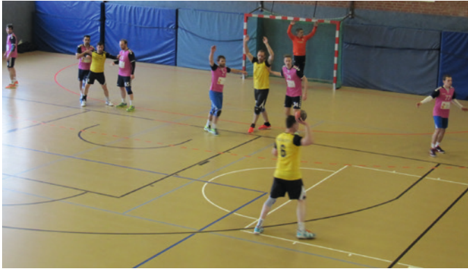
Spiel bei SCALA