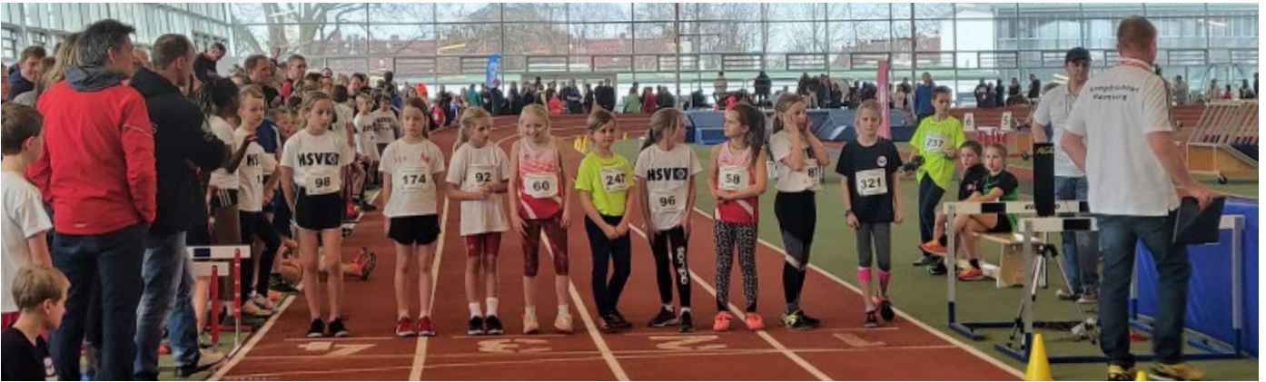
Bereit für den 800m Start