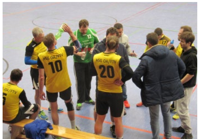
Minikader - Timeout