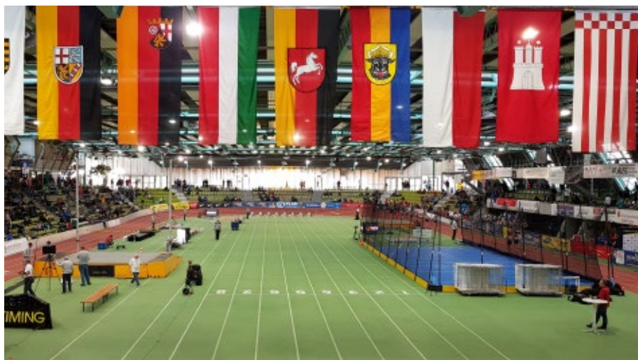
Der Glaspalast in Sindelfingen, der Schauplatz für die diesjährigen Deutschen Hallenmeisterschaften der Jugend.

Im großen Finale am Sonntag konnte sie sich sehr gut gegen die 2-3 Jahre ältere Konkurrenz durchsetzen und legte einen spannenden Kampf um Platz 2 hin.