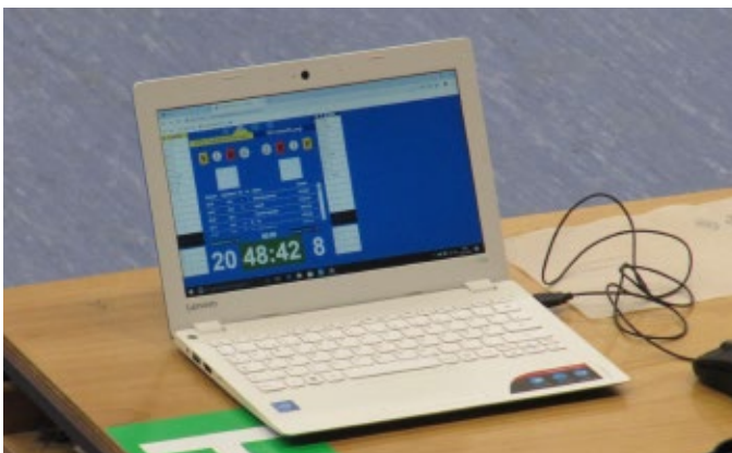
Neueste Technik - Ergebnisdienst online möglich