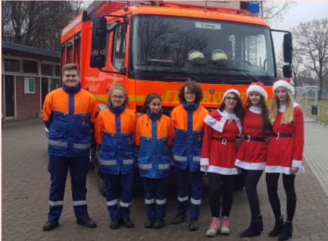
Die freiwillige Feuerwehr Farmsen war mit einem Einsatzwagen vor Ort und informierte die Besucher über ihre Arbeit.