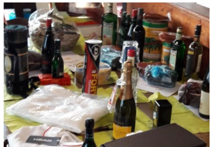
Der gut und reichlich bestückte Tisch mit den Gewinnen.